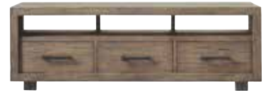
TV-meubel 3 laden, 3 vakken H59xB175xD45cm