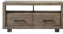
TV-meubel 2 laden, 2 vakken H59xB120xD45cm