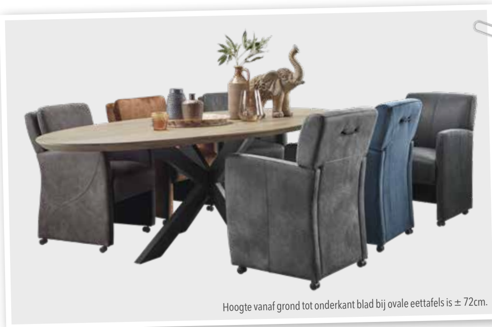
Hoogte vanaf grond tot onderkant blad bij ovale eettafels is \pm 72 cm.