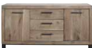
Dressoir 2 deuren, 3 laden H79xB162xD45cm 10159469