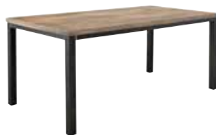
Eettafel L220xB100xH78cm ±207cm 10159450 L250xB105xH78cm ±237cm 10159447