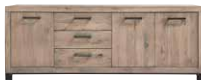
Dressoir 3 deuren, 3 laden H79xB207xD45cm 10150269

KEUZE UIT 4 SOORTEN AFWERKINGEN & VELE KLEUREN