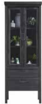
Vitrinekast 2 glasdeuren, 2 laden H195xB72xD36cm