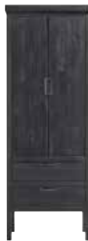
Kast 2 deuren, 2 laden H195xB72xD36cm