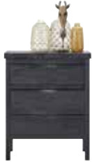
Kastje 3 laden H90xB72xD42cm