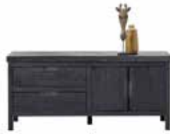
TV-meubel 2 deuren, 1 klep, 1 lade H63xB138xD42cm