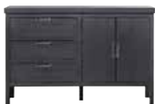
Dressoir 2 deuren, 3 laden H90xB138xD42cm