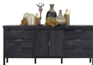
Dressoir 2 deuren, 6 laden H90xB204xD42cm