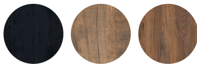
Old piano Orient Sheesham