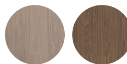
Misty oak Hazel