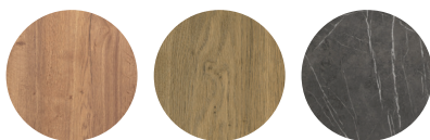
Barley Natur Pedra