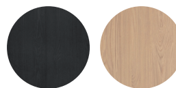
Noir** Blond oak